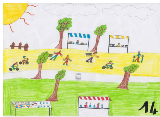
3 ème prix (Pénélope)