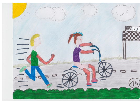
2 ème prix (Margaux)