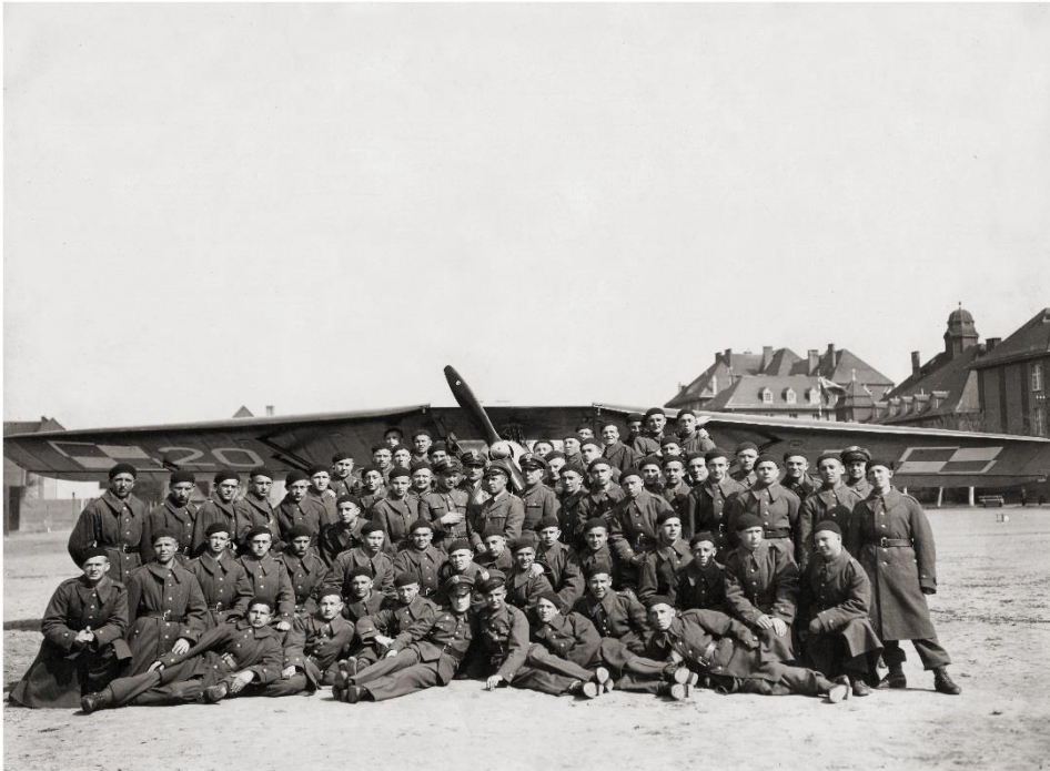
Moderówka 1939, école de pilotage sur RWD-8 (Stanisław Caliński 3 ème rang gauche, 7 ème gauche),

Caliński revint à l'école supérieure de Krosno en août 1939 pour reprendre sa formation en deuxième année. Son groupe d'élèves pilotes fut envoyé vers l'aéroport de réserve à Moderówka où ils furent formés au pilotage d'avions à moteur RWD-8. Au déclenchement de la Deuxième Guerre mondiale, Caliński se trouvait sur cet aéroport.