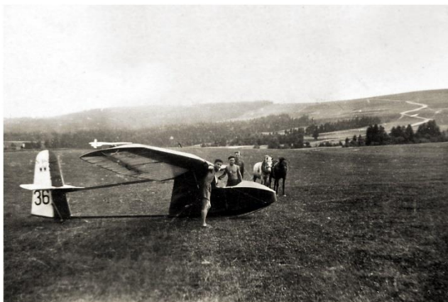
1938-1939 : école de pilotage sur planeur