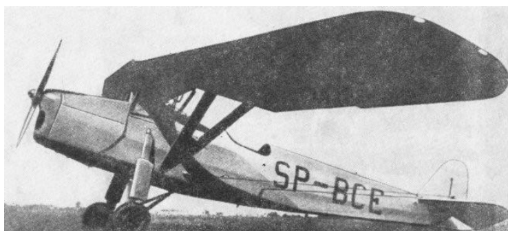
To RWD-8, samolot do ćwiczeń silowych polerowanie lotnicze

Już pierwszego dnia o godz. 6:00 przeżył nalot lotnictwa niemieckiego – Luftwaffe. W ocalałych fragmentach zapisków wspominał o tragicznych skutkach nalotu: 6 poległych oraz 14 rannych kolegach, a także o zniszczonych 17 samolotach RWD-8. Straty byłyby zapewne wyższe, gdyby na wieść o zaatakowaniu Polski nie została odwołana poranna gimnastyka.