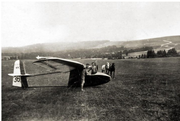
1938-1939 : szkoła lotów szybowcowych